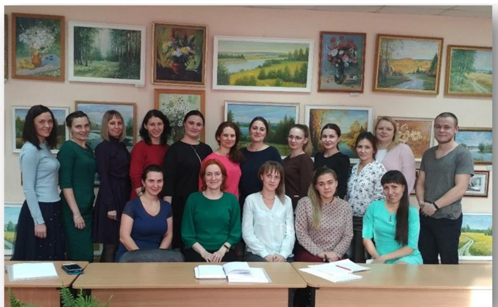
Молодежный конвент «Роль молодых педагогов в реализации национального проект «Образование»